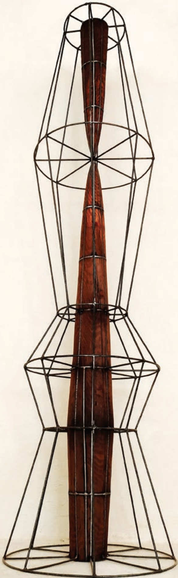
مهدی رنگچی . شماره ۱۳ چوب و آهن . ۲۳۵×۶۴×۶۴ سانتی متر . ۱۳۹۶ Mehdi Rangchi . No 13 Wood and metal . 235×64×64 cm . 2017