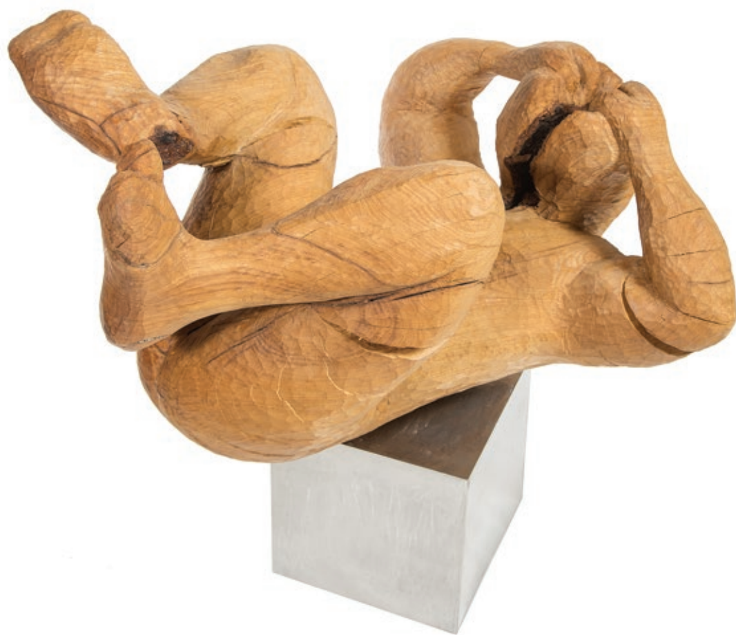
یاشار آذر امدادیان . دوگانه . چوب بلوط . ۱۰۵×۸۰×۸۰ سانتی متر . ۱۳۹۰ Yashar Azar Emdadian . DOGANEH . oak wood sculpture . 105x80x80 cm . 2011