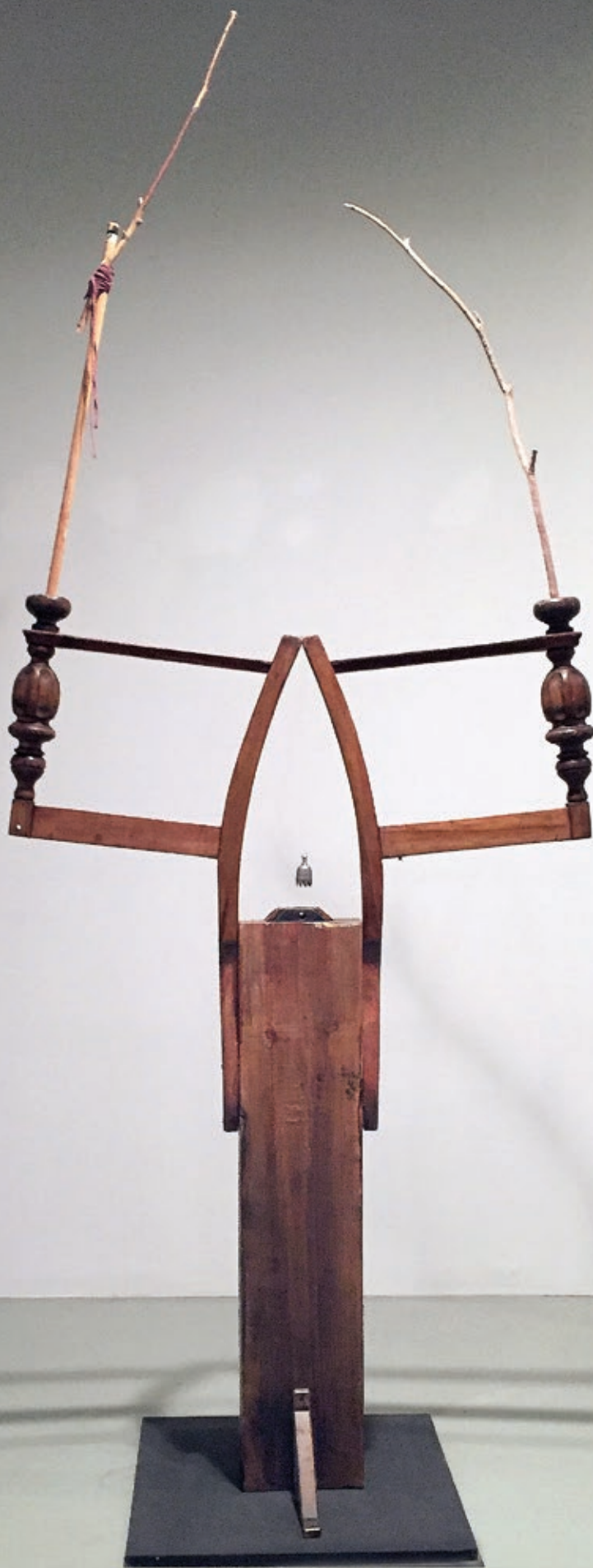
شقایق عربی . شناور اشیاء یافته شده و ترکیب مواد . ۲۷۰×۱۰۸×۴۴ سانتی متر . ۱۳۹۵ Shaqayeq Arabi . Float found objects and mix media . 270×108×44 cm . 2016