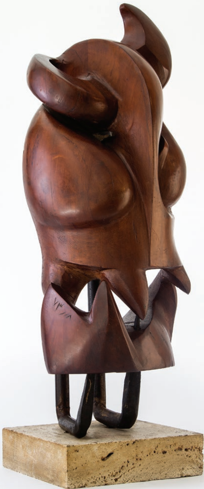
محمدعلی مددی . از مجموعه دیوها چوب و فلز . ۷۴×۳۰×۲۴ سانتی متر . ۱۳۷۳ Mohammad Ali Maddadi From Series "Divs" . wood 74×30×24 cm . 1994