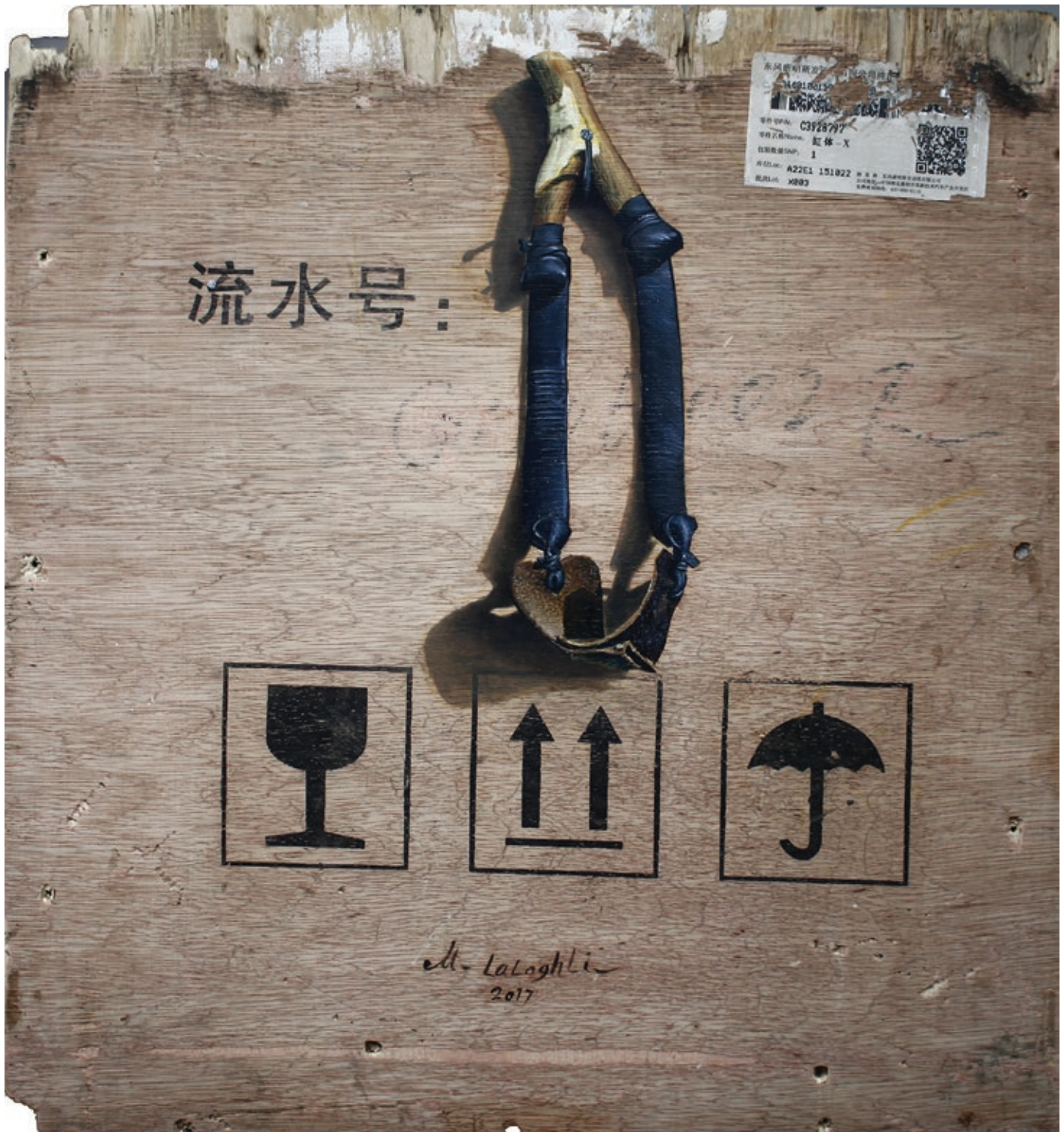
مجید کامرانی . از مجموعه عاشقانه‌ها . رنگ و روغن روی صفحه چوب جعبه بسته‌بندی . ۴۳×۴۵ سانتی‌متر . ۱۳۹۶ Majid Kamrani . From series "Romantic Ballads" . Oil painting and print on wooden crates . 43x45 cm . 2017