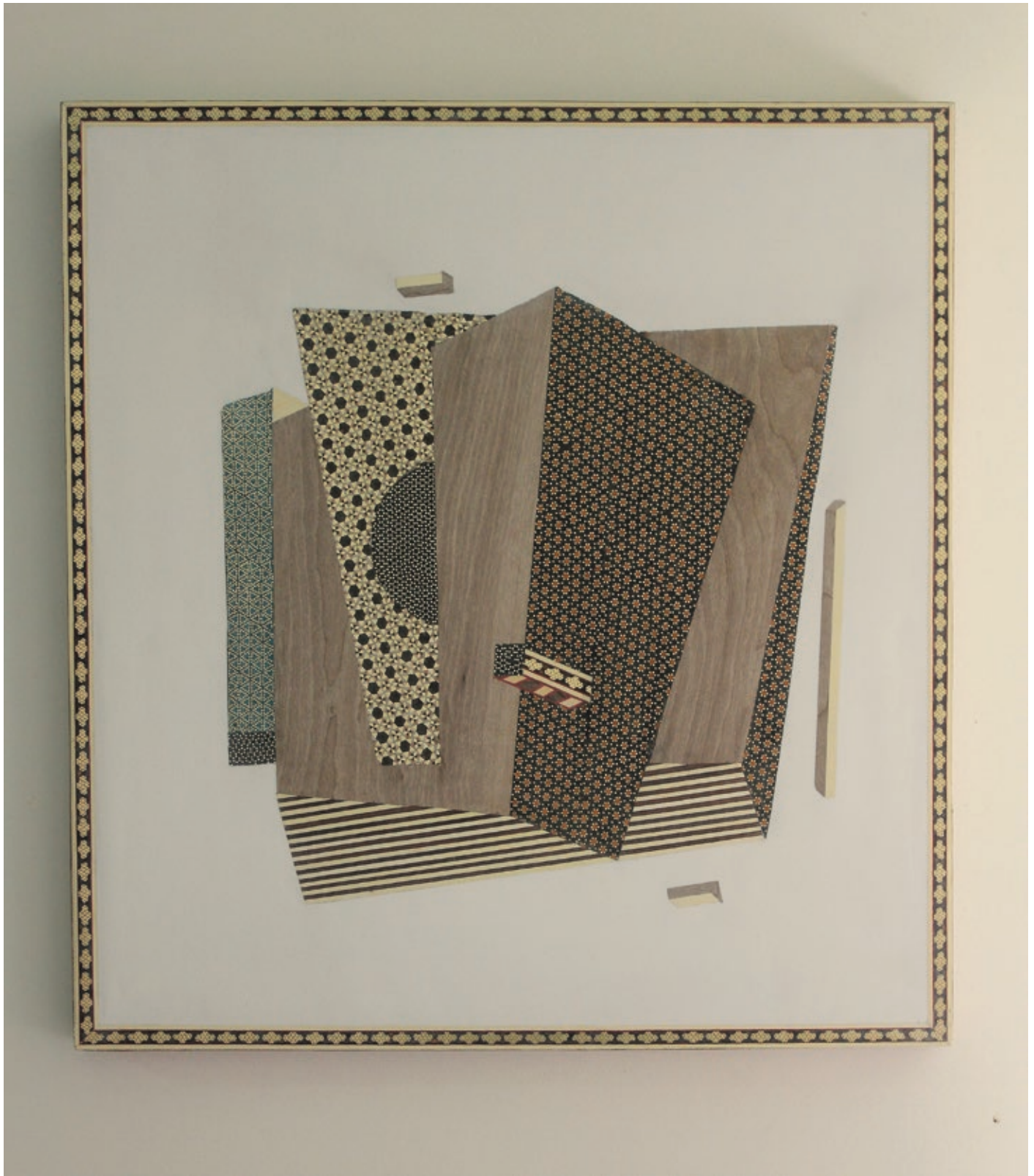
فرهاد اهرارنیا . دریاست که با خورشید درآمیخته . خاتم . ۴۳×۴۵ سانتی‌متر . ۱۳۹۴ Farhad Ahrarnia . It's the Sea Fused with the Sun . Khatam-Iranian Marquetry . 43×45 cm . 2015