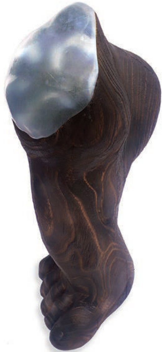
محمد مروستی . از مجموعه خنیاگر . چوب . ۳۰×۱۱×۱۷ سانتی متر . ۱۳۹۰ Mohammad Marvasti . Minstrel . wood . 30×11×17 cm . 2011