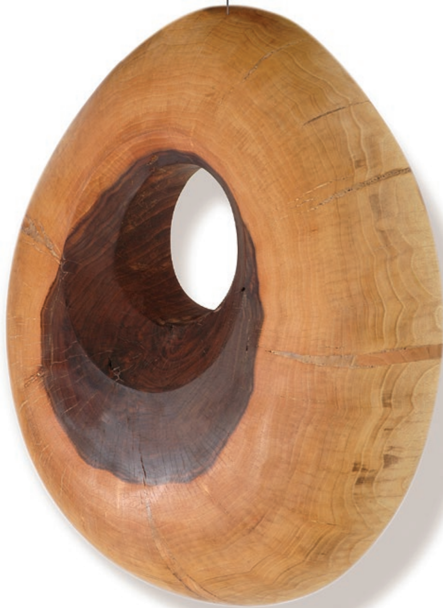
هومن سلیمی . حفره . چوب . ۷۰×۵۵×۱۵ سانتی متر . ۱۳۹۱ Houman Salimi . Cavity . wood . 70x55x15 cm . 2012