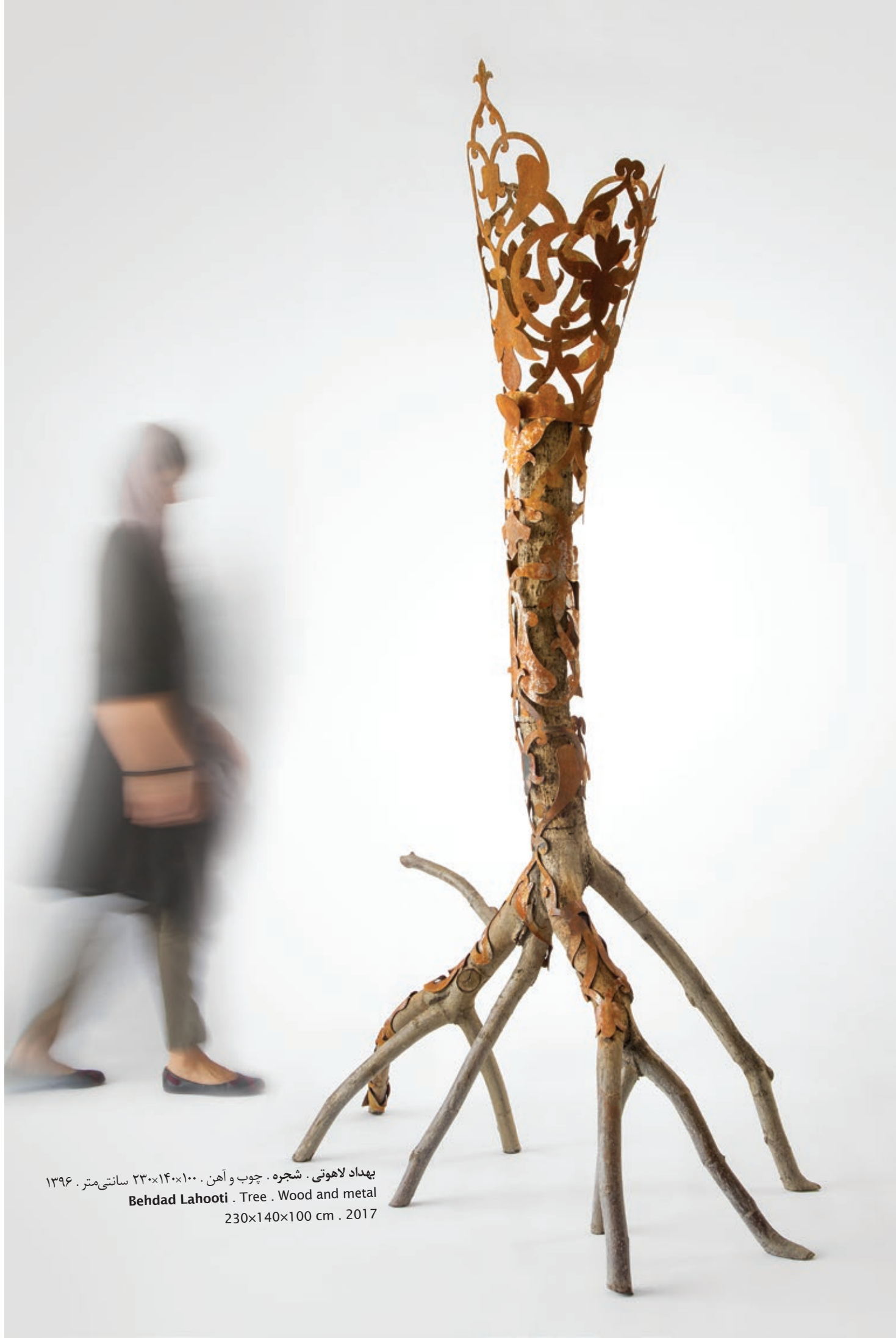
بهداد لاهوتی . شجره . چوب و آهن . ۲۳۰×۱۴۰×۱۰۰ سانتی متر . ۱۳۹۶ Behdad Lahooti . Tree . Wood and metal 230x140x100 cm . 2017