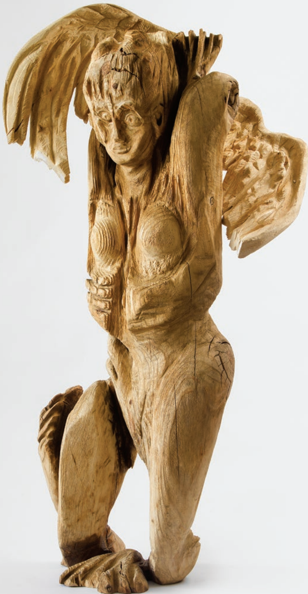
منصور طیب‌زاده . هیوط چوب . ۱۰۵×۶۰×۴۰ سانتی‌متر . ۱۳۹۴ Mansour Tabibzadeh . Descent wood . 105×60×40 cm . 2015