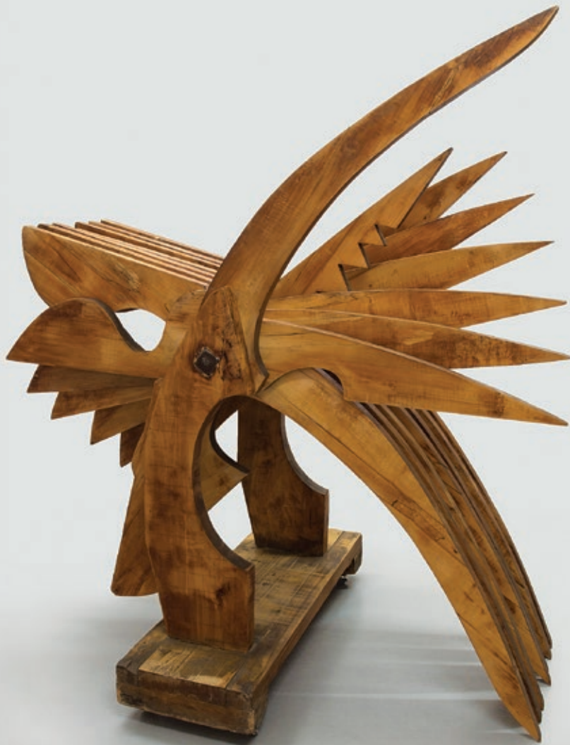
محسن وزیری مقدم . بدون عنوان از مجموعه مجسمه‌های مفصلی . چوب . ۲۰۵×۹۲×۳۶ سانتی‌متر متشکل از ۱۷ قطعه . ۱۳۴۹ Mohsen Vaziri Moghaddam . Untitled From Series "Articulated Sculpture" . wood . 205×92×36 cm (17 Pieces) . 1970